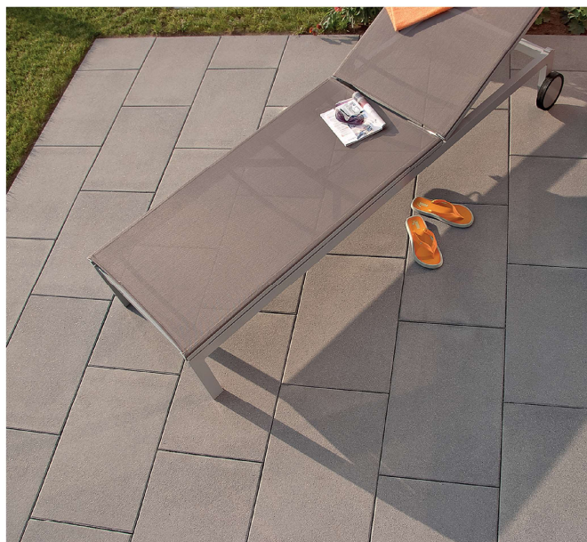
NUEVA light ferro DTE100 Anthrazit-Uni 60/40/5 cm