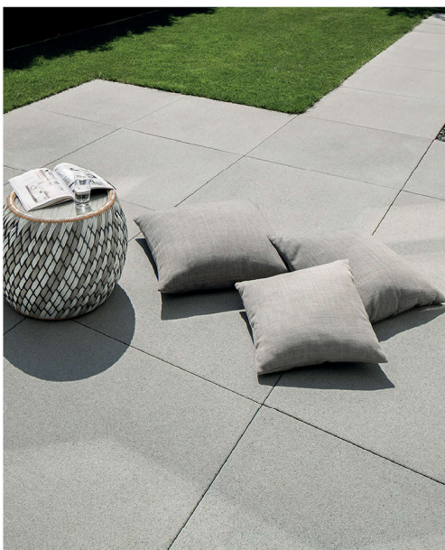
NUEVA light ferro DTE100 Grau-Uni 100/100/5,5 cm