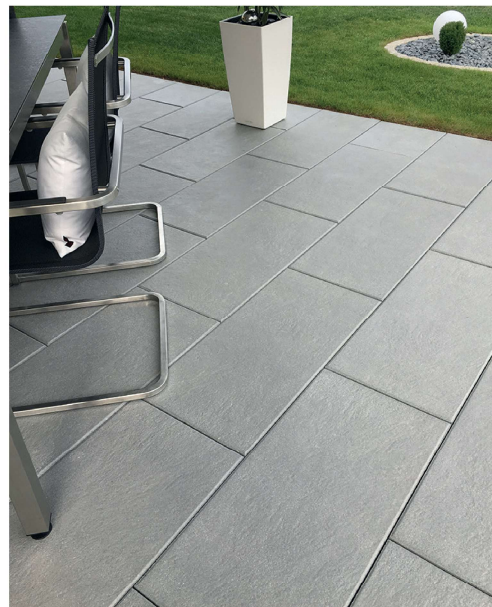
TIARO DTE900 Arktis-Grau 80/40/5 cm